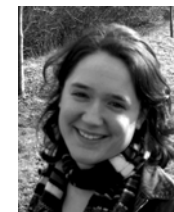
Kathrin Moosdorf Jahrgang 1981 Bundesvorsitzende